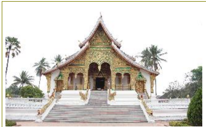
พระราชวัง และ หอพิพิธภัณฑ์หลวงพระบาง