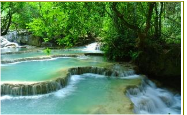
น้ำตกกวาสี