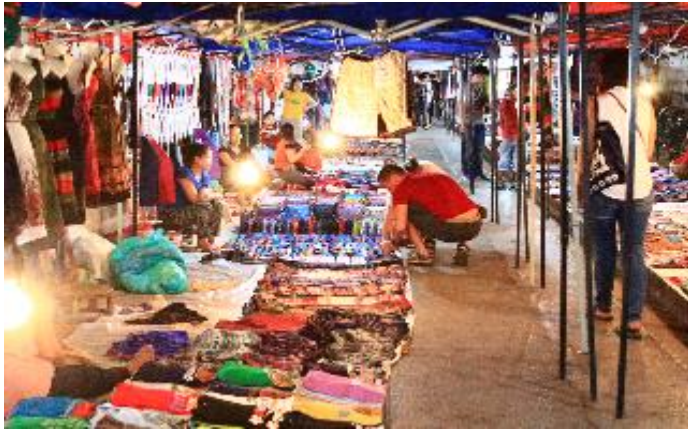
บรรยากาศตลาดกลางคืน