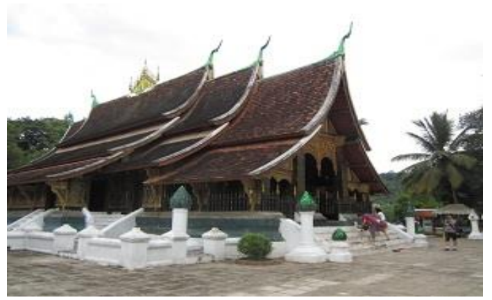
วัดเชิงทอง